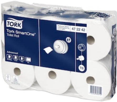
Tork Smartone® Papel Higiénico 472242